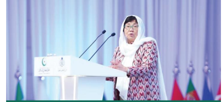
الممثلة الخاصة للأمم العام للأمم المتحدة في أفغانستان روزا أوتونباييفا خلال المؤتمر الدولي حول المرأة في الإسلام

أكدت أن الأمم المتحدة تضطلع بدور محوري في تمكين المرأة. لا سيما في مجالي التعليم والعمل. مسيطرة الضوء على معايير الأمم المتحدة ومبادراتها الرامية إلى النهوض بوضع المرأة في هذين المجالين المهمين.