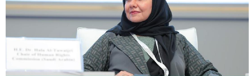
رئيسة هيئة حقوق الإنسان بالملكة العربية السعودية الدكتورة هلا بنت مزيد التويجري خلال المؤتمر الدولي حول المرأة في الإسلام

أشارت إلى أنّ حقوق المرأة شهدت نقلات نوعية وكبيرة في استعادة حقوقها بفضل جهود هذه المنظمات. حيث نالت حقها في التعليم، والعمل، وحقوقها السياسي، وخسنت ظروفها المهنية وحتى الأسرية. لافتة إلى أنّ تمكين المرأة على الصعيد العالمي لنيل حقوقها جاء مواكبة للحقوق المدنية التي بدأت تمنح للعديد من شرائح المجتمع على المستوى الاجتماعي أو على المستوى المهني أو السياسي.