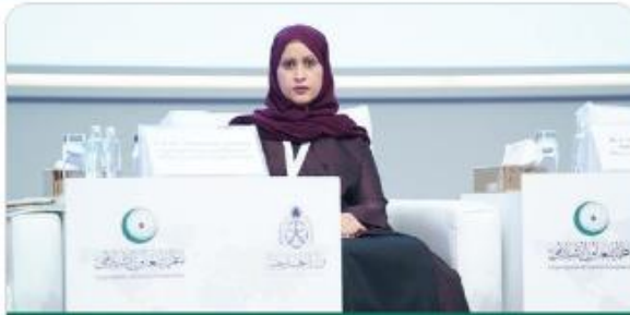
Secretary-General of the Family Affairs Council in Saudi Arabia Dr. Maimunah Al Khalil During the International Conference on Women in Islam

Addressed the legislative requirements for empowering women in education and work, stating that these two fields are a critical focus in international efforts for women's empowerment.