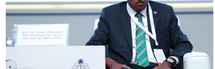
الأمين العام المساعد للشؤون الإنسانية والاجتماعية والأسرة بمنظمة التعاون الإسلامي السفير طارق علي بخت خلال المؤتمر الدولي حول المرأة في الإسلام

Explained that the OIC's ongoing efforts to empower women have led to the establishment of the "Women Development Organization." Additionally, a considerable number of specialized organs associated with the OIC have allocated significant portions of their programs to address issues concerning Muslim women, their rights, empowerment programs, and the development of their roles in Muslim communities.