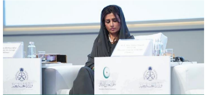
وزيرة الدولة السابقة للشؤون الخارجية في باكستان حنا رباني خزار خلال المؤتمر الدولي حول المرأة في الإسلام

أوضحت أنّ مشاركة المرأة المسلمة في الدبلوماسية محدودة تاريخياً، وذلك بسبب الأدوار التقليدية للجنسين. إلا أنّ التحول بدأ يظهر تدريجياً مع سعي المزيد من النساء المسلمات إلى العمل في مجال الدبلوماسية والعلاقات الدولية.