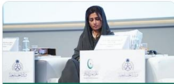
Former Minister for Foreign Affairs in Pakistan Hina Rabbani Khar During the International Conference on Women in Islam

Affirmed that women's involvement in diplomatic affairs is of increasing value and importance globally, highlighting some of the opportunities and challenges facing Muslim women who aspire to participate actively in diplomatic work