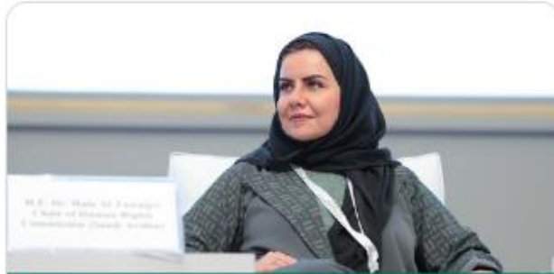
President of the Human Rights Commission in the Kingdom of Saudi Arabia Dr. Hala bint Mazyad Al-Tuwaijri During the International Conference on Women in Islam

Explained that women's rights have seen significant global developments over the past two centuries due to the Industrial Revolution and the profound transformations it imposed on societies. These developments led to the emergence of international and local human rights organizations dedicated to advocating for human rights in general and women's rights in particular.