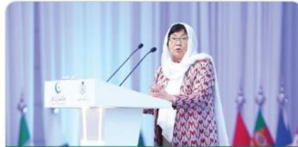
Special Representative of the UN Secretary-General in Afghanistan Rosa Otunbayeva During the International Conference on Women in Islam

Confirmed that the United Nations plays a pivotal role in empowering women, particularly in the fields of education and employment, and highlighted the UN's standards and initiatives to advance women's status in these crucial areas.