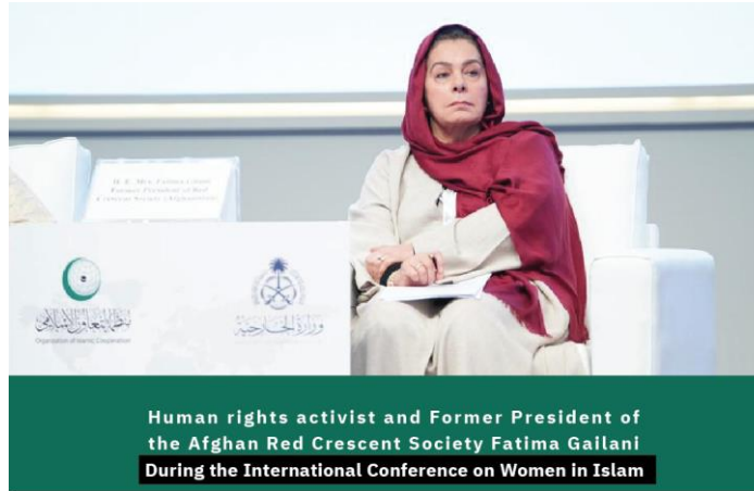
Human rights activist and Former President of the Afghan Red Crescent Society Fatima Gailani During the International Conference on Women in Islam

Pointed out that balancing deeply rooted domestic traditions and Islamic principles poses a complex challenge, especially in countries like Afghanistan, where local scholars face the dilemma of clearly distinguishing between traditional laws and Islamic principles.