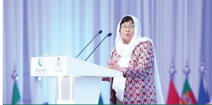
Special Representative of the UN Secretary-General in Afghanistan Rosa Otunbayeva During the International Conference on Women in Islam

Confirmed that the United Nations plays a pivotal role in empowering women, particularly in the fields of education and employment, and highlighted the UN's standards and initiatives to advance women's status in these crucial areas.