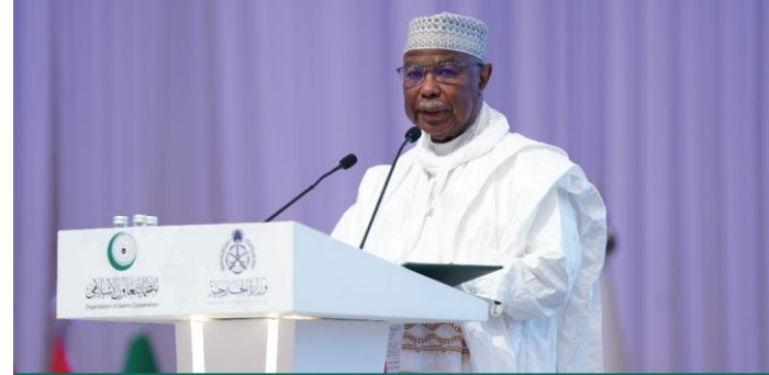
Secretary-General of the Organization of Islamic Cooperation Hissein Brahim Taha During the International Conference on Women in Islam

Affirmed that the OIC will continue to prioritize women's empowerment issues and will initiate and adopt numerous efforts and initiatives aimed at improving the conditions of women in Muslim societies.