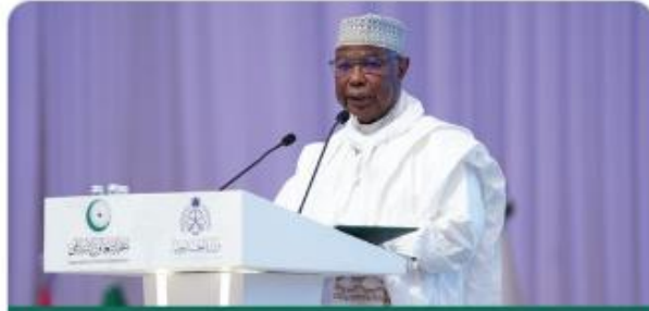
الأمين العام لمنظمة التعاون الإسلامي حسين إبراهيم طه خلال المؤتمر الدولي حول المرأة في الإسلام

أكد أن منظمة التعاون الإسلامي ستبقي على أوضاع الأمين العام أن وثيقة جدة حول المرأة قضايا تمكين المرأة ضمن سلم أولوياتها. في الإسلام تمثل مسارا فكريا وعمليا يعتمد من طرف المؤسسات التشريعية والهيئات والمبادرات التي من شأنها تحسين ظروف النساء الحقوقية في الدول الأعضاء وكافة المجتمعات المسلمة عند النظر في حقوق المرأة المسلمة.