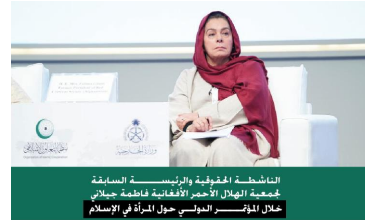
الناشطة الحقوقية والرئيسة السابقة لجمعية الهلال الأحمر الأفغانية فاطمة جيلاني خلال المؤتمر الدولي حول المرأة في الإسلام

اعتبرت أن التعايش بين التقاليد المحلية المتجذرة ومبادئ الإسلام يشكل تحديًا معقدًا. في دول مثل أفغانستان، حيث يواجه العلماء المحليون معضلة في التمييز بوضوح بين القوانين التقليدية والمبادئ الإسلامية.