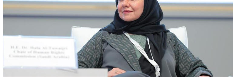
President of the Human Rights Commission in the Kingdom of Saudi Arabia Dr. Hala bint Mazyad Al-Tuwaijri During the International Conference on Women in Islam

Explained that women's rights have seen significant global developments over the past two centuries due to the Industrial Revolution and the profound transformations it imposed on societies. These developments led to the emergence of international and local human rights organizations dedicated to advocating for human rights in general and women's rights in particular.