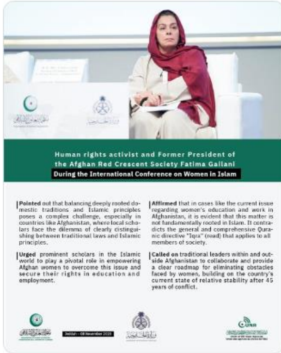
Human rights activist and Former President of the Afghan Red Crescent Society Fatima Gailani During the International Conference on Women in Islam

Pointed out that balancing deeply rooted domestic traditions and Islamic principles poses a complex challenge, especially in countries like Afghanistan, where local scholars face the dilemma of clearly distinguishing between traditional laws and Islamic principles.