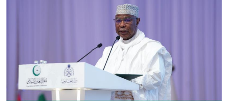
الأمين العام لمنظمة التعاون الإسلامي حسين إبراهيم طه خلال المؤتمر الدولي حول المرأة في الإسلام

Highlighted the OIC's efforts in supporting Palestinian women, noting that the extraordinary Islamic summit, scheduled for Saturday, November 11, 2023, in Riyadh, at the invitation of Saudi Arabia, will address Israel's aggression against Gaza and its repeated violations of international norms.