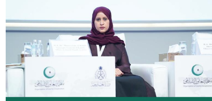
الأمين العام لمجلس شؤون الأسرة في السعودية الدكتورة ميمونة الخليل خلال المؤتمر الدولي حول المرأة في الإسلام

تطرّقت إلى المتطلبات التشريعية لتمكين المرأة في التعليم والعمل، مبينة أنّ تمكين المرأة في هذين المجالين يعدّ أبرز محور في الجهود الدولية لتمكين المرأة. كونهما أهم مؤشرات الاندماج الفعال للمرأة في المجتمع.