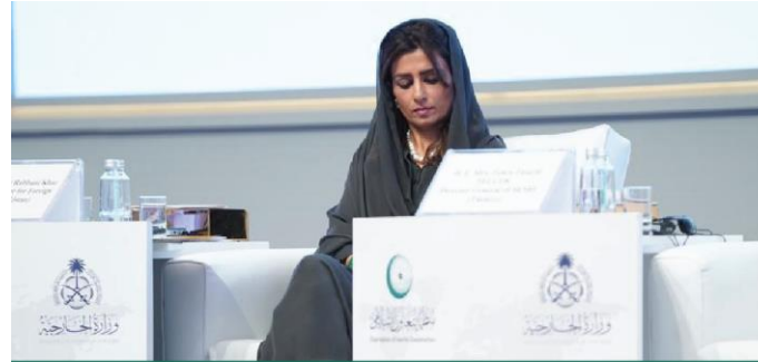
Former Minister for Foreign Affairs in Pakistan Hina Rabbani Khar During the International Conference on Women in Islam

Affirmed that women's involvement in diplomatic affairs is of increasing value and importance globally, highlighting some of the opportunities and challenges facing Muslim women who aspire to participate actively in diplomatic work